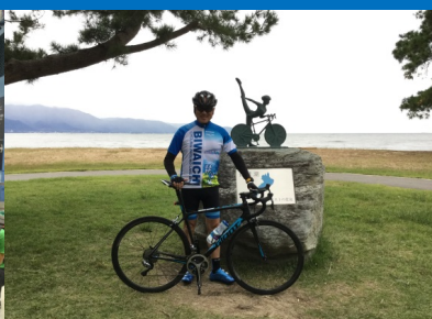
場面に応じた記念写真