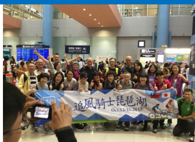
関西国際空港へのお出迎え