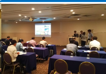
県内各地域の魅力プレゼンテーション