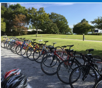
レンタサイクル準備