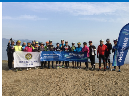
ツアーに合わせた歓迎幕