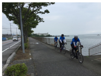
実走によるルート確認

これまで、自治体の様々な招請事業（FAM）や、サイクリングツアーに携わってきた。品質向上のため、先進地視察、実走によるルート確認、コース造成に取り組んでいる。