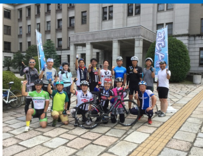
撮影（DVD等で記念アルバム作成）