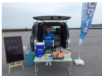
おもてなし・サポート力向上