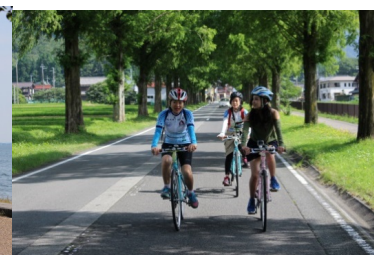
メタセコイア並木（高島）