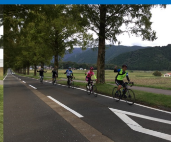
走行時の記念写真