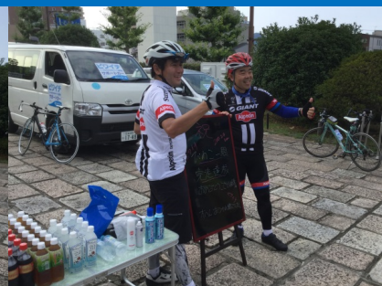
補給食や飲料、各地域の果物等を用意