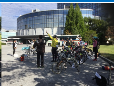
ガイドの用意・準備体操