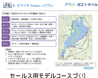
セールス用モデルコースづくり