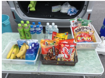
果物など、地域によって変える