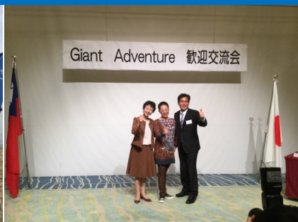
地元自治体によるお出迎え