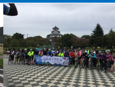
各地での記念写真