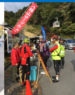
サイクルラック準備