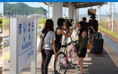
サイクルトレイン