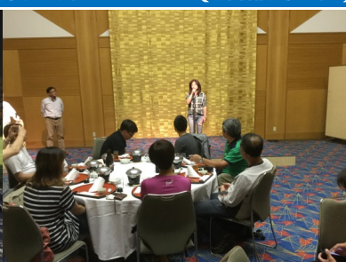
旅行会社担当から意見を聴く