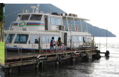
ショートカットクルーズ（オーミマリン）